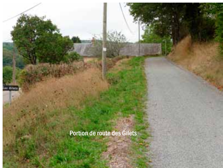
Portion de route des Gilets