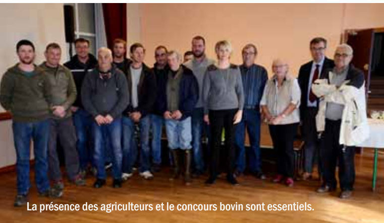
La présence des agriculteurs et le concours bovin sont essentiels.

La foire des galvachers est vraiment un hommage à l'histoire et aux traditions d'Anost, un clin d'œil à nos ancêtres qui partaient sur les routes pour nourrir leurs familles. Merci à tous ceux qui œuvrent pour que cette fête perdure. Vous pouvez rejoindre le comité des foires et marchés pour aider à l'organisation.